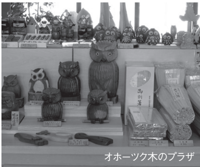
オホーツク木のプラザ

「具体的なイメージが湧かない」、「取り組みたいけど、どうしたらいいかわからない」、「これって産消協働なの?」そんな疑問をお持ちの皆さんはぜひ!